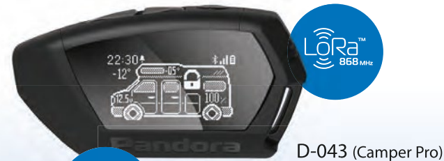
D-043 (Camper Pro)

Diese Option ist auch für das Pandora Camper-System verfügbar